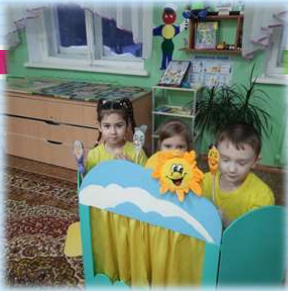
Разыгрывание сказок в группе